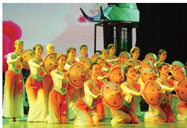
歌舞《日子越过越精彩》