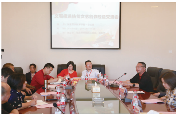
武陵山区文联推进扶贫文艺创作经验交流会·现场