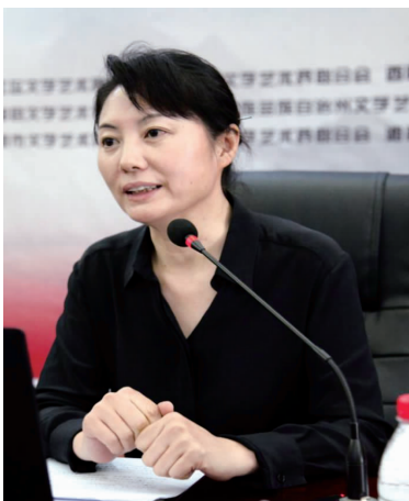
居 杨 (中国摄影家协会副主席)

文学艺术该如何助力扶贫？在研讨会上，与会专家纷纷表示，在扶贫题材文艺创作上，不仅要反映和表现老百姓的贫困生活，更要告诉他们这种贫困生活的由来，向他们展示脱贫攻坚的美好前景。