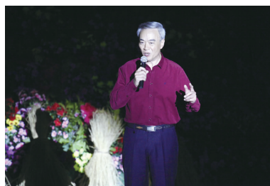
主持人陈天陆 (国家一级演员、著名表演艺术家)