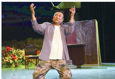
姚居德 情景剧《抉择》 (国家一级演员、著名表演艺术家)