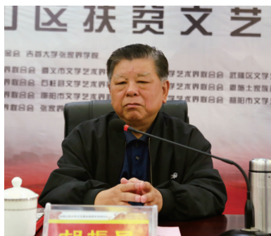
胡振民 (中国关心下一代工作委员会常务副主任)