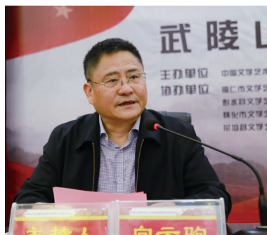
向云驹 (中国文学艺术基金会副理事长、秘书长)