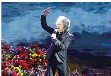
徐涛 诗朗诵《生死交响》 (国家一级演员、著名配音演员)