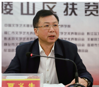
夏义生 (湖南省文联党组书记)