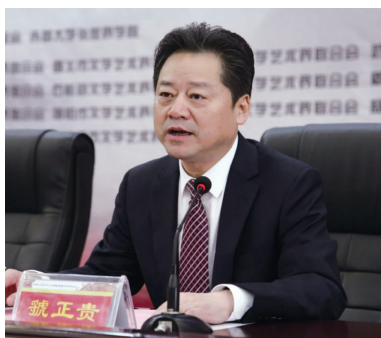
虢正贵 (中共张家界市委书记)