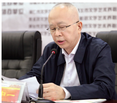
左中一 (全国人大常委会、中国文联副主席)