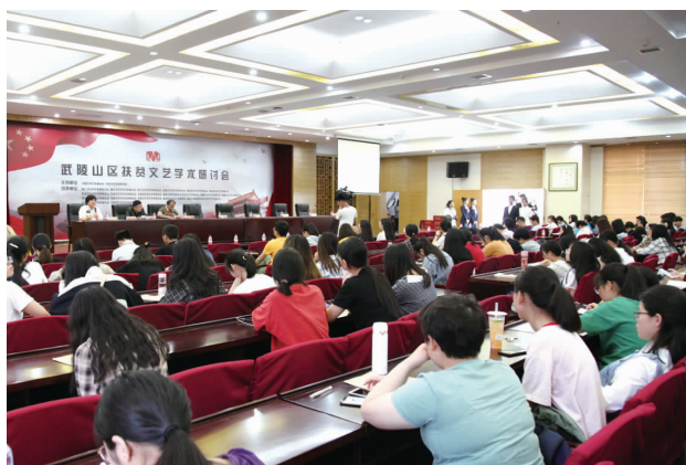
扶贫文艺作者见面会·现场