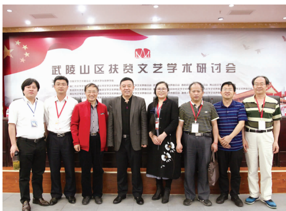
扶贫文艺作者见面会·合影

在武陵山区文联推进扶贫文艺创作经验交流会上,来自各地文联的负责人分享了文艺扶贫经验。在扶贫文艺作者见面会上,部分创作扶贫文学作品的作家与当地读者进行了创作交流。